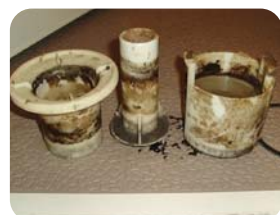
排水トラップもこんなに汚れています。