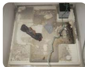
移動できない洗濯機の下は、汚れがいっぱいです。